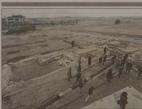
Vista general de les excavacions amb la piscina que s'ha descobert, a l'esquerra de la imatge